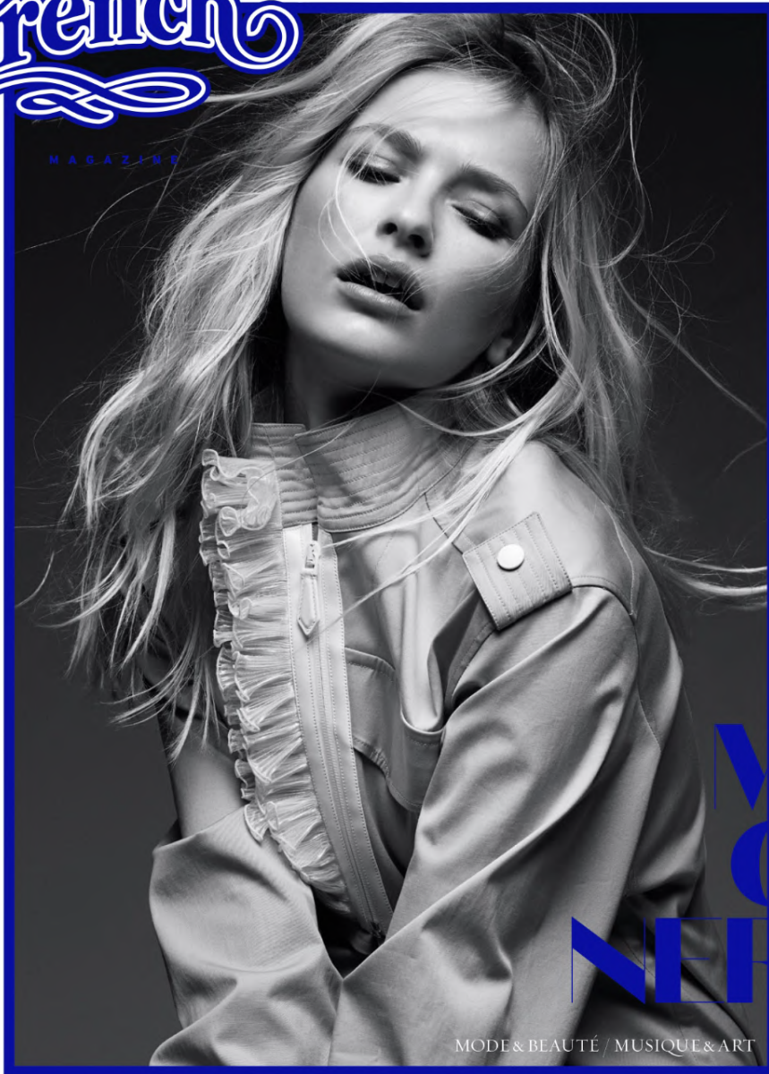
CAMILLE RAZAT / LOUIS VUITTON