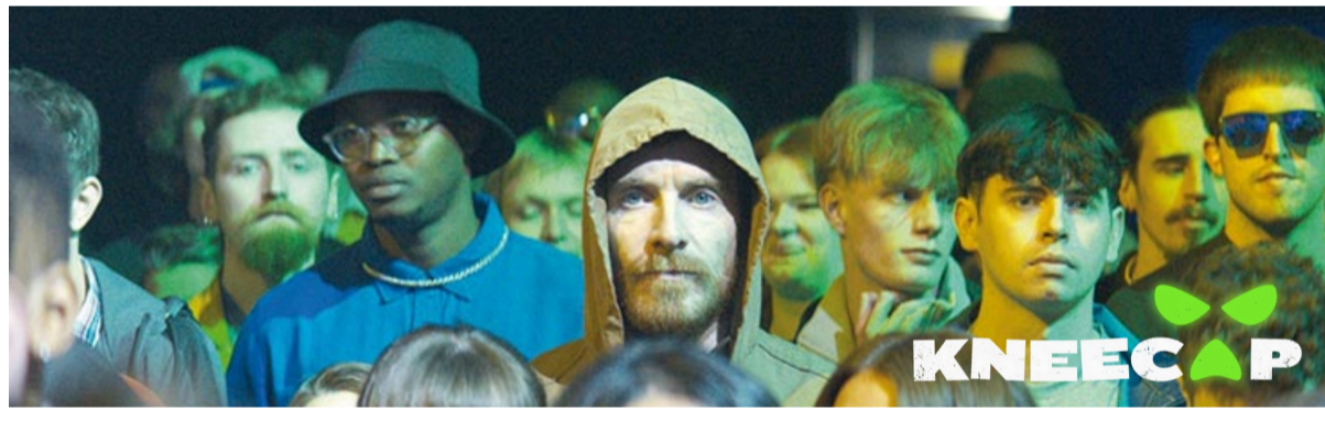
Michael Fassbender dans Kneecap

Le film irlandais qui fait sensation en festivals et a représenté son pays dignement aux Oscars s'invite en avant-première dans de nombreux cinémas la semaine du 17 mars . Il n'est pas trop tard ! Réservez